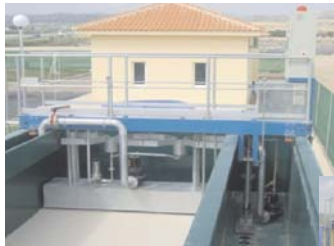
Filtración con arena. Pumlac®