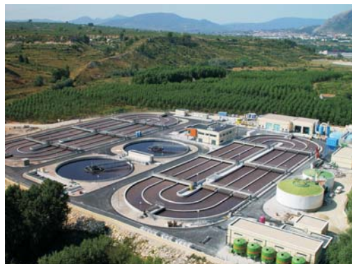
EDAR Font de la Pedra

Volumen agua depurada: 19,3 Hm 3 /año. Volumen agua regenerada: 11,4 Hm 3 /año. Inversión: 31,79 Mill.€.